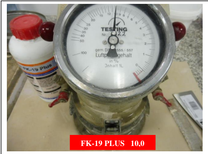
FK-19 PLUS 10,0