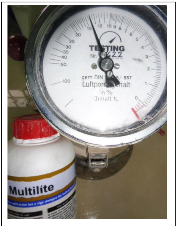
MULTILITE 14,0 %