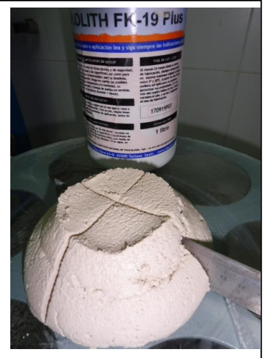
FK-19 PLUS 127